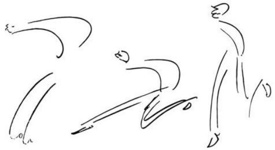
Dibujos realizados por Kafka en sus diarios y diarios de viaje.

Estas dos metáforas, la del peso y la de la corrosión, transpuestas al fuero interno se convierten en una comparecencia ante un tribunal invisible que mide la ofensa, pronuncia la condena e infringe el castigo.