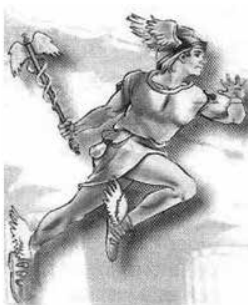
Hermes – Mercurio con el Caduceo en la mano

En la mitología griega, Hermes era el hijo de Zeus y de la ninfa Maya, la más joven de las Pléyades. Vino al mundo en una caverna del monte Cileno. Muy precoz, de recién nacido ya se mostró lleno de astucia. Su madre, según la costumbre, le había fajado estrechamente en pañales, dejándole en un cajón que le servía de cuna. Pero Hermes, a fuerza de removerse, encontró