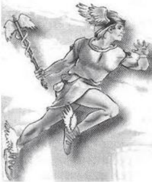
Hermes – Mercurio con el Caduceo en la mano

En la mitología griega, Hermes era el hijo de Zeus y de la ninfa Maya, la más joven de las Pléyades. Vino al mundo en una caverna del monte Cileno. Muy precoz, de recién nacido ya se mostró lleno de astucia. Su madre, según la costumbre, le había fajado estrechamente en panales, dejándole en un cajón que le servía de cuna. Pero Hermes, a fuerza de removerse, encontró la manera de soltarse y poniéndose en camino, se fue hasta Tesalia, donde su hermano Apolo guardaba los rebanos de vacas del rey Admeto. Hermes le robó la mitad del rebaño.