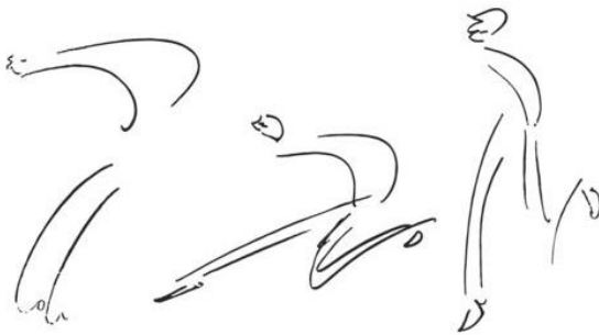
DIBUJOS REALIZADOS POR KAFKA EN SUS DIARIOS Y DIARIOS DE VIAJE.

Otra fuente consultada fueron sus Diarios; aquí nuevamente aparecen en forma muy clara muchos de los síntomas hallados en la CARTA AL PADRE. Es interesante recordar que Kafka nunca pensó en publicar sus Diarios y sus Cartas,