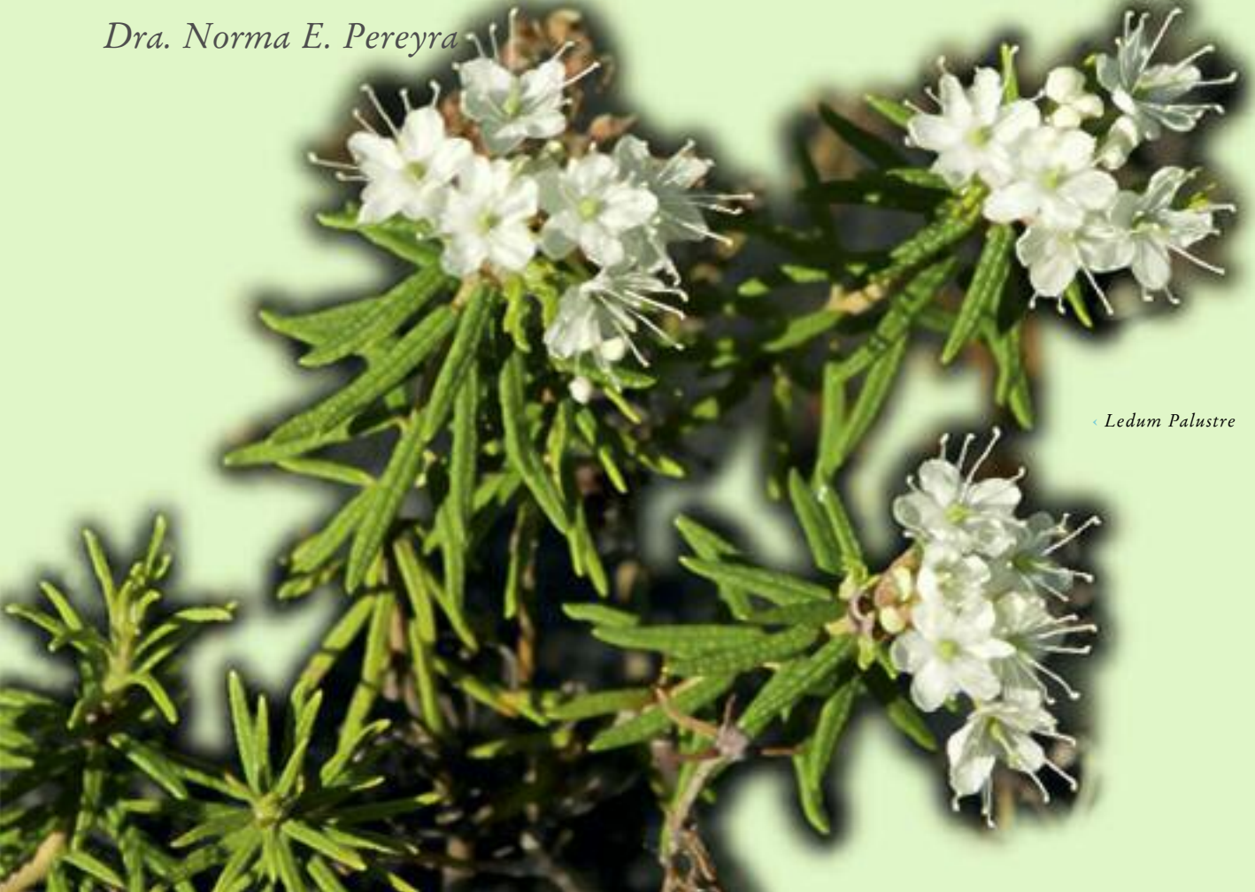
◀ Ledum Palustre