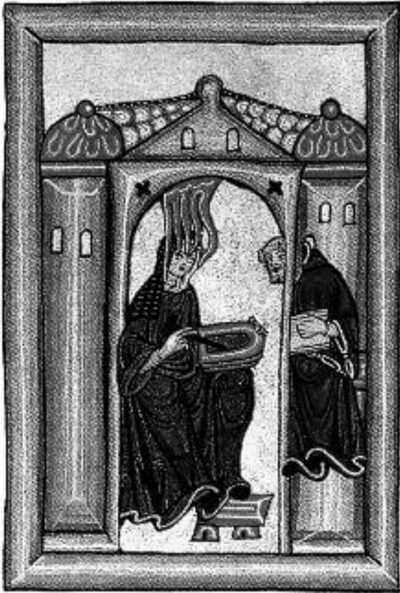
Protestificatio de Scivias, Fol. 1, Facsímil de Eibingen del Códice de Ruperstberg