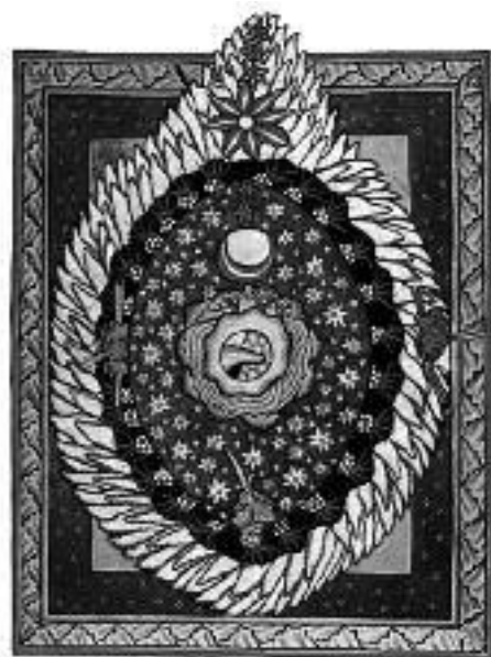
El Universo, Fol. 14, Scivias I, 3.

Por todo esto, vaya hacia la Patrona de la Medicina Natural, mi humilde homenaje. ✨